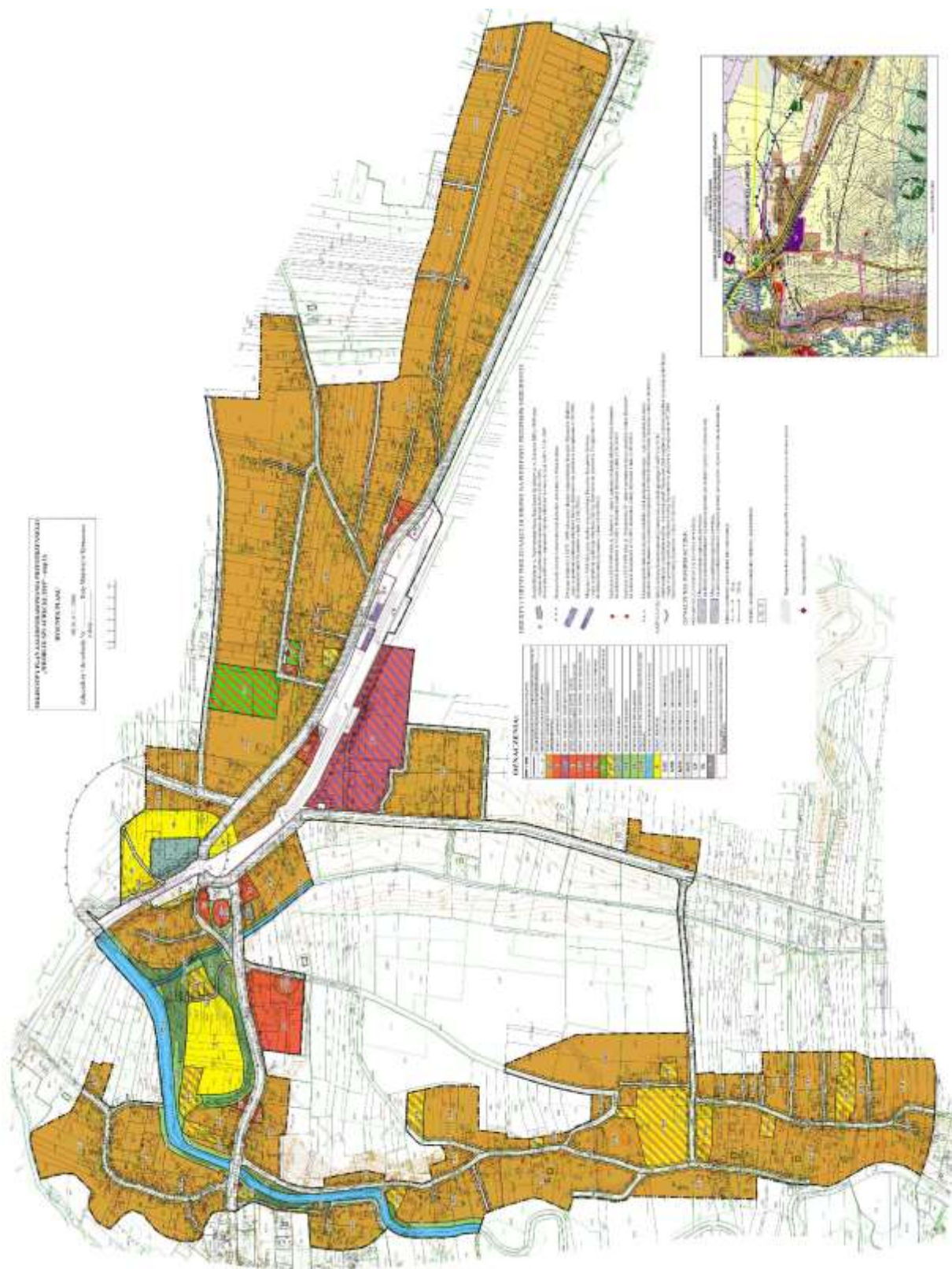
Rysunek 2. Rysunek projektu Miejsowego Planu Zagospodarowania Przestrzennego „Wróblík Szlachecki/2019” – etap IA (pomniejszenie).