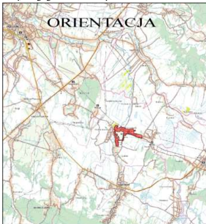
Rysunek 1. Teren objęty projektem planu „Wróblík Szlachecki/2019” – etap IA.

Obszar planu obejmuje część miejscowości Wróblík Szlachecki z licznie występującą zabudową mieszkaniową jednorodzinną. Na omawianym terenie występuje również zabudowa zagrodowa, usługowa, w tym: usługi publiczne, sakralne, a także sportu i rekreacji, oraz zabudowa produkcyjno-usługowa. Niezabudowaną część stanowią tereny rolne występujące w północnej i północno-wschodniej części objętej projektem planu. Przez środkową część terenu przepływa potok Morwawa. Teren projektu planu obejmuje również tereny kolejowe zlokalizowane w północnej części, na granicy planu oraz tereny komunikacji, w tym drogę powiatową, drogi gminne i wewnętrzne.