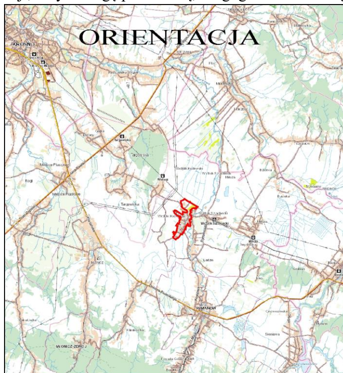
Rysunek 1. Teren objęty projektem planu „Wróblík Królewski/2019” – etap I.

Obszar planu obejmuje południową część miejscowości Wróblík Królewski z licznie występującą zabudową mieszkaniową jednorodzinną. Na omawianym terenie występuje również zabudowa zagrodowa, usługowa, w tym: usługi publiczne, sakralne, kultu religijnego, a także sportu i rekreacji, oraz zabudowa produkcyjno-usługowa. Niezabudowaną część stanowią tereny rolne występujące w północnej i północno-wschodniej części objętej projektem planu. Przez środkową część terenu przepływa potok Klimkówka. Teren projektu planu obejmuje również tereny kolejowe zlokalizowane w północnej części, na granicy planu oraz tereny komunikacji, w tym drogę powiatową, drogi gminne i wewnętrzne.