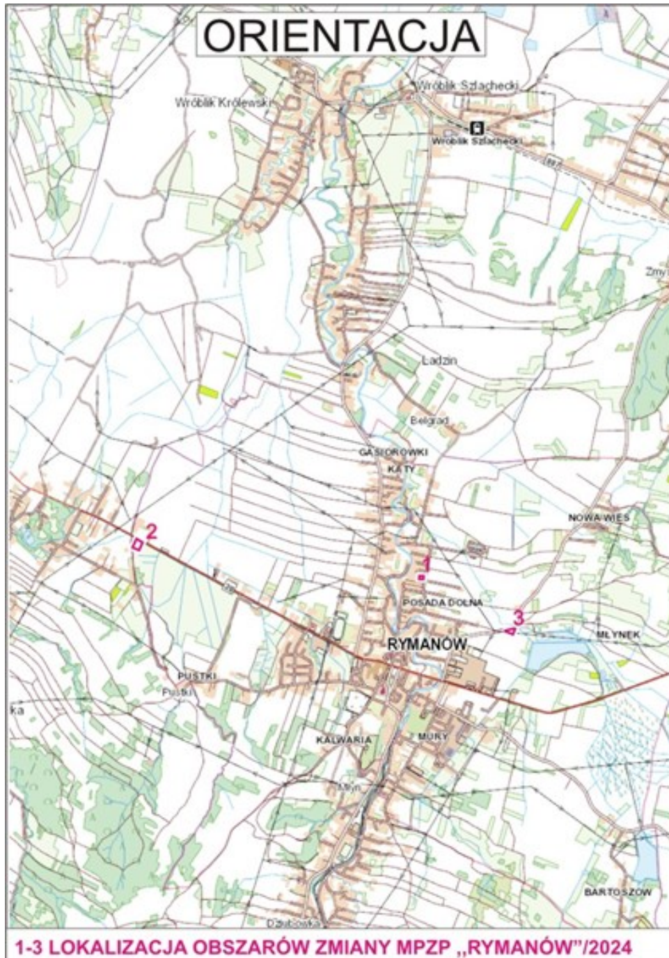
Rysunek 1. Lokalizacja obszarów objętych projektem zmiany planu.

Rejon ten budują utwory przedczwartorzędowe warstw krośnieńskich dolnych, środkowych i górnych (trzeciorzęd, oligocen), do których należy zaliczyć: piaskowce grubo i średnioławicowe, łupki i piaskowce średnio i gruboławicowe oraz piaskowce cienkoławicowe i łupki. Utwory te wietrzejąc tworzą na powierzchni gliny, gliny pylaste i piaszczyste, pyły i piaski pylaste oraz gliny czwartorzędowe zwietrzelinowe i różnej genezy, natomiast dolinę potoku Morwawa budują holocenijskie gliny, ropy i mułki z domieszką piasków (mady) oraz piaski i żwiry rzeczne tarasów nadzalewowych.