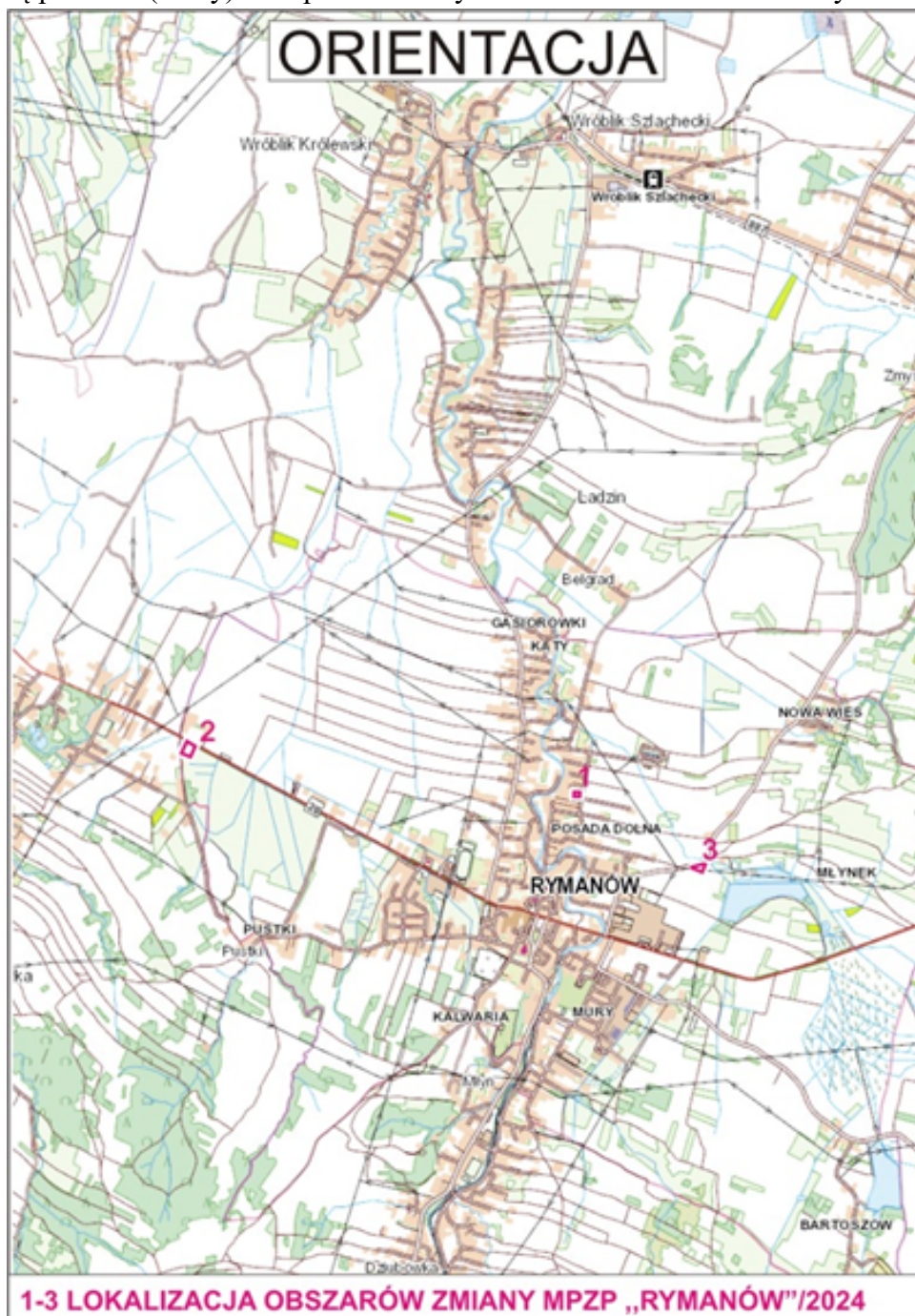
Rysunek 1. Lokalizacja obszarów objętych projektem zmiany planu.

Rejon ten budują utwory przedczwartorzędowe warstw krośnieńskich dolnych, środkowych i górnych (trzeciorzęd, oligocen), do których należy zaliczyć: piaskowce grubo i średnioławicowe, łupki i piaskowce średnio i gruboławicowe oraz piaskowce cienkoławicowe i łupki. Utwory te wietrzejąc tworzą na powierzchni gliny, gliny pylaste i piaszczyste, pyły i piaski pylaste oraz gliny czwartorzędowe zwietrzelinowe i różnej genezy, natomiast dolinę potoku Morwawa budują holocenijskie gliny, ropy i mułki z domieszką piasków (mady) oraz piaski i żwiry rzeczne tarasów nadzalewowych.