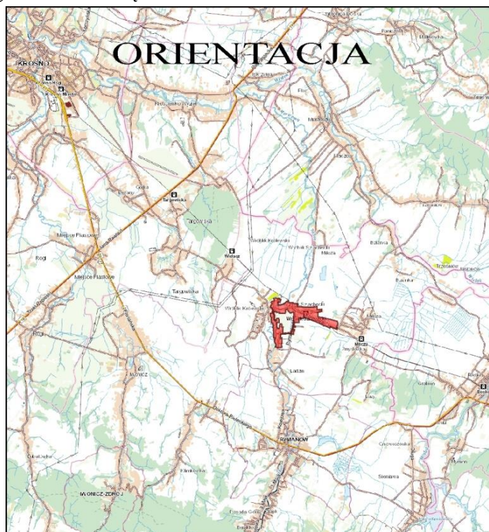
Rysunek 1. Teren objęty projektem planu „Wróblík Szlachecki/2019” – etap IA.

Obszar planu obejmuje część miejscowości Wróblík Szlachecki z licznie występującą zabudową mieszkaniową jednorodzinną. Na omawianym terenie występuje również zabudowa zagrodowa, usługowa, w tym: usługi publiczne, sakralne, a także sportu i rekreacji, oraz zabudowa produkcyjno-usługowa. Niezabudowaną część stanowią tereny rolne występujące w północnej i północno-wschodniej części objętej projektem planu. Przez środkową część terenu przepływa potok Morwawa. Teren projektu planu obejmuje również tereny kolejowe zlokalizowane w północnej części, na granicy planu oraz tereny komunikacji, w tym drogę powiatową, drogi gminne i wewnętrzne.