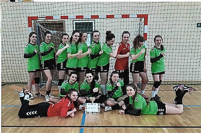
Szczypiornistki UKS Gem