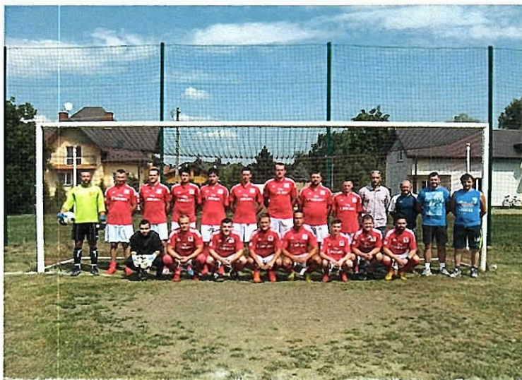
Pilkarze LUKS Beskid