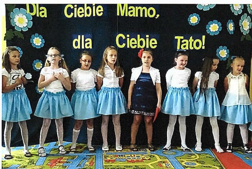
Dzień Matki i Ojca