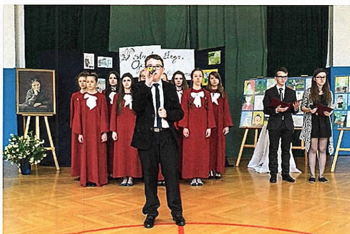
Obchody Dnia Patrona w ZSP w Posadzie Górnej