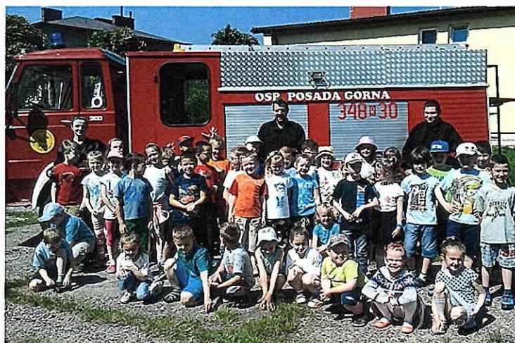
Uczniowie ZSP podczas wizyty w OSP