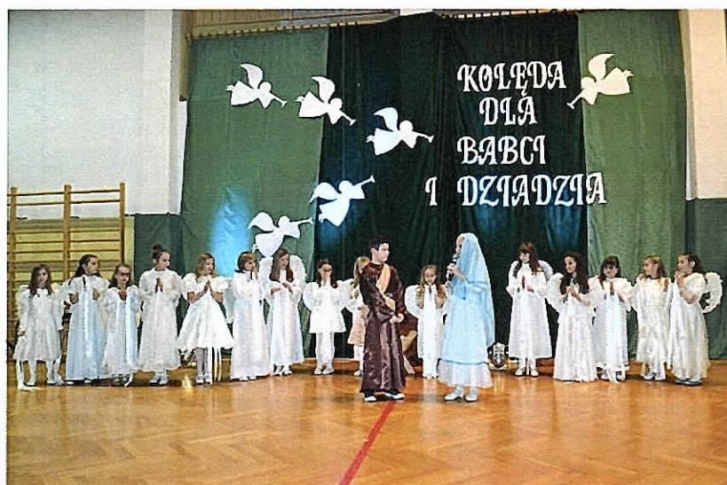
Dzień Babci i Dziadka