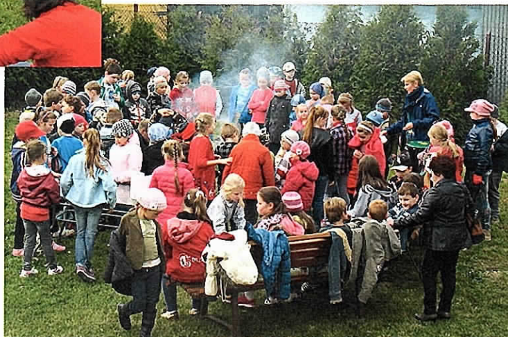
Święto pieczonego ziemniaka