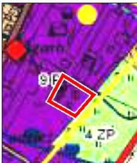
WYRYS ze STUDIUM UWARUNKOWAŃ I KIERUNKÓW ZAGOSPODAROWANIA PRZESTRZENNEGO GMINY RYMANÓW KIERUNKI ZAGOSPODAROWANIA PRZESTRZENNEGO

W Studium obszar objęty zmianą planu został określony jako „Teren zabudowy produkcyjnej składów i magazynów, w tym zabudowy produkcyjno-usługowej”. Studium, jako funkcję uzupełniającą dla tego terenu ustala zabudowę usługową. Zapisy studium dają możliwość wprowadzenia funkcji uzupełniających zarówno, jako towarzyszących funkcji podstawowej, jak również jako samodzielnych funkcji danego terenu. Projekt zmiany Miejscowego Planu Zagospodarowania Przestrzennego „RYMANÓW” uwzględnia kierunki zagospodarowania oraz inne ustawowe ustalenia określone w Studium, tym samym nie narusza ustaleń Studium Uwarunkowań i Kierunków Zagospodarowania Przestrzennego Gminy Rymanów.