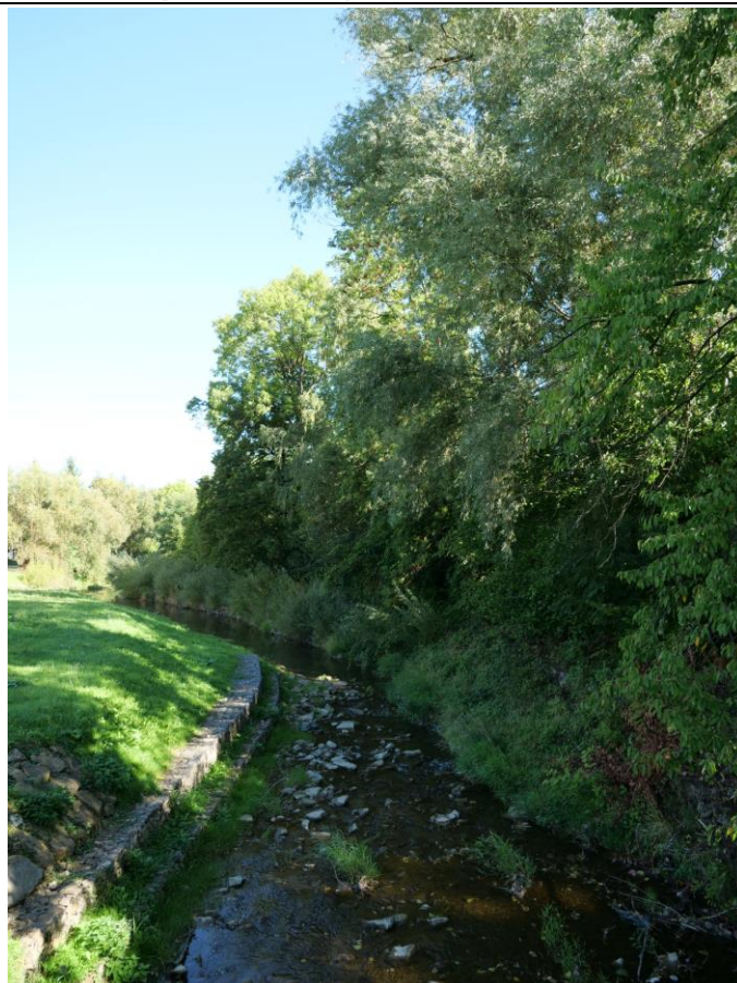
Fot. 4. Potok Morwawa (Tabor) z obudową biologiczną (zadrzewienia i roślinność nadrzeczna).

Znaczna część objętego projektem Zmiany Planu jest przekształcona. W bezpośrednim sąsiedztwie drogi wojewódzkiej znajdują się obiekty OSP/Policji, garaże. Część terenu wykorzystywana jest jako parking. Wzdłuż drogi wojewódzkiej, na trawniku, również parkują samochody. Brzegi potoku Morwawa porastają zadrzewienia i zakrzewienia.