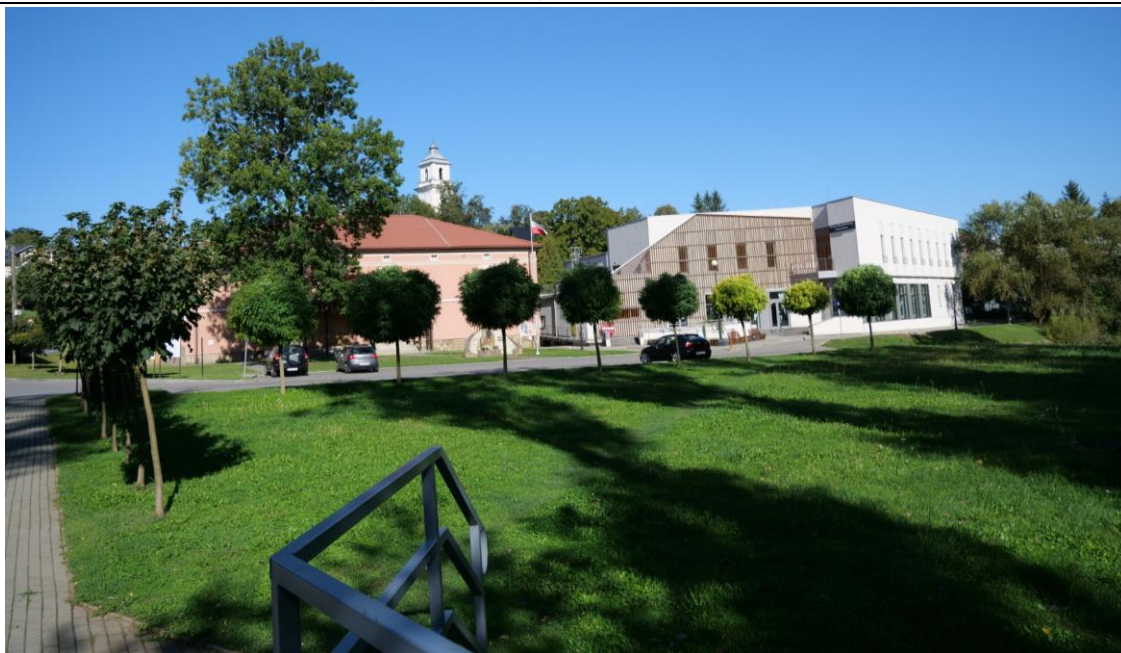
Fot. 2. Zieleni urządzone w sąsiedztwie obszaru objętego projektem Zmiany Planu (stan istniejący).