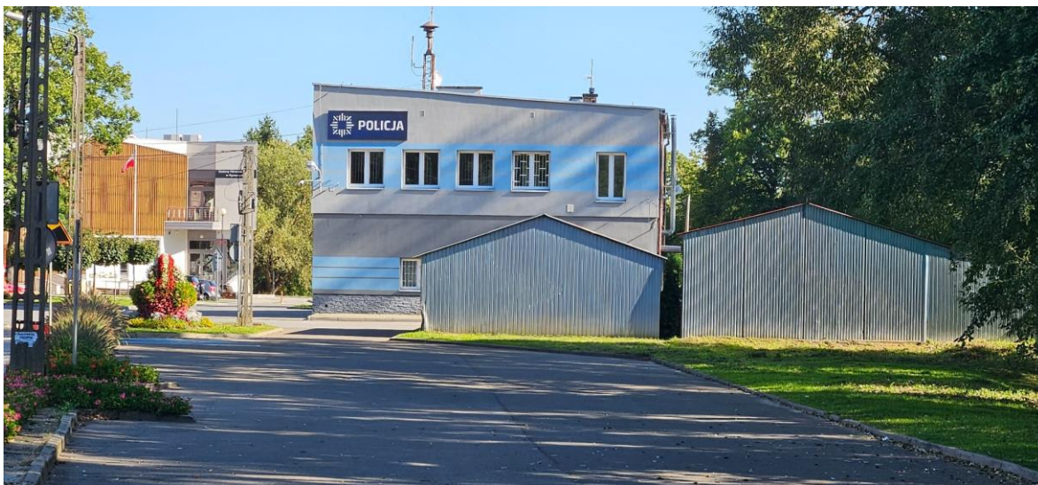
Fot. 1. Teren objęty projektem Zmiany Planu – obiekty Policji/OSP wraz z najbliższym otoczeniem (stan istniejący).