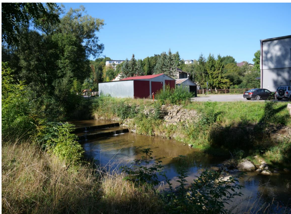
Fot. 3. Potok Morwawa (Tabor) w sąsiedztwie obszaru objętego projektem Zmiany Planu oraz część terenu objęta opracowaniem.